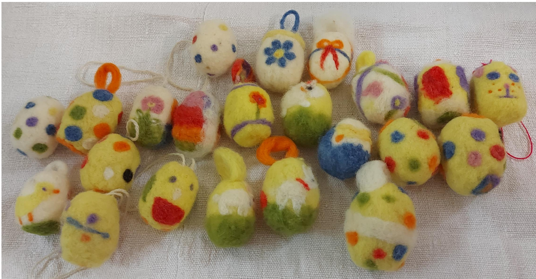
KONČNI IZDELKI UČENCEV 5. RAZREDA OŠ ŠMARTNO V TUHINJU, APRIL 2022