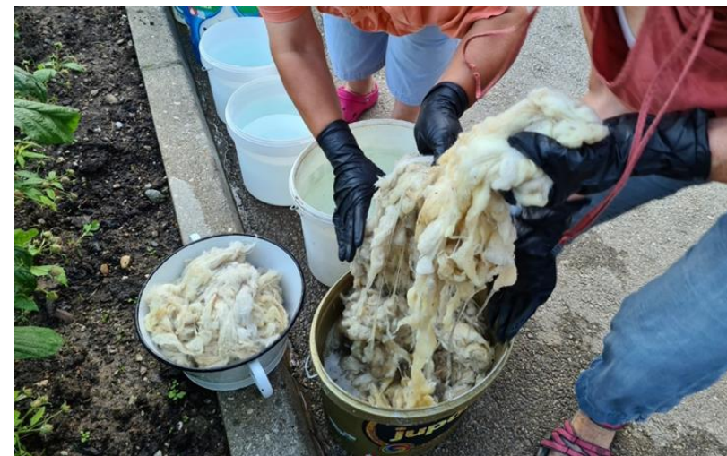
Pranje volnenih vlaken