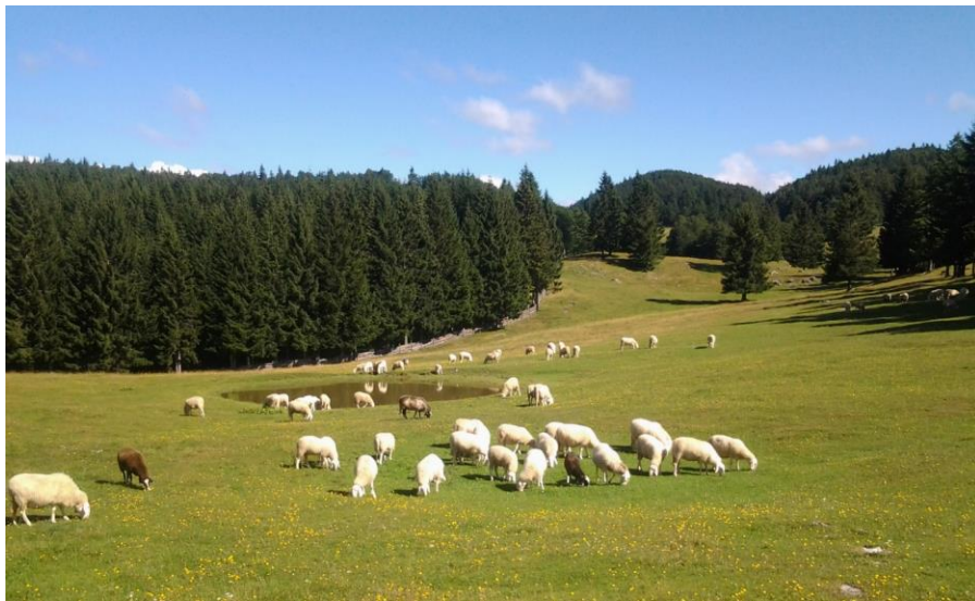
Ovce na paši