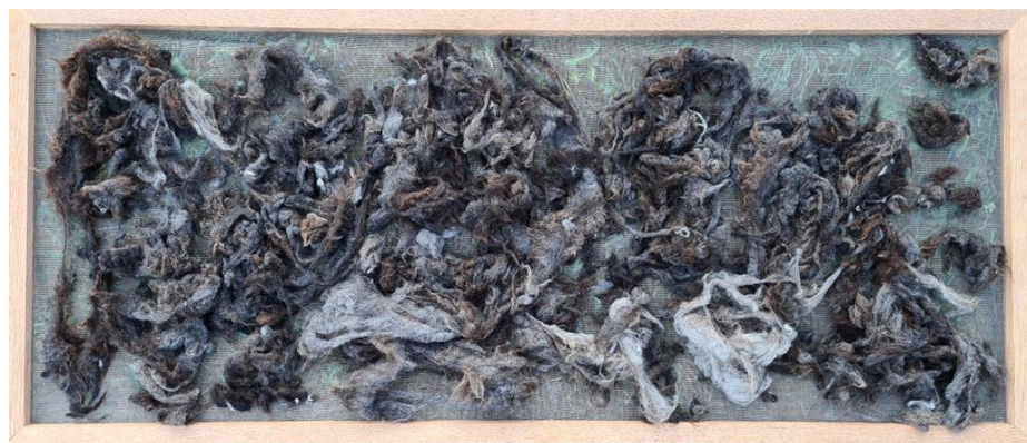
Sušenje volnenih vlaken črne ovce